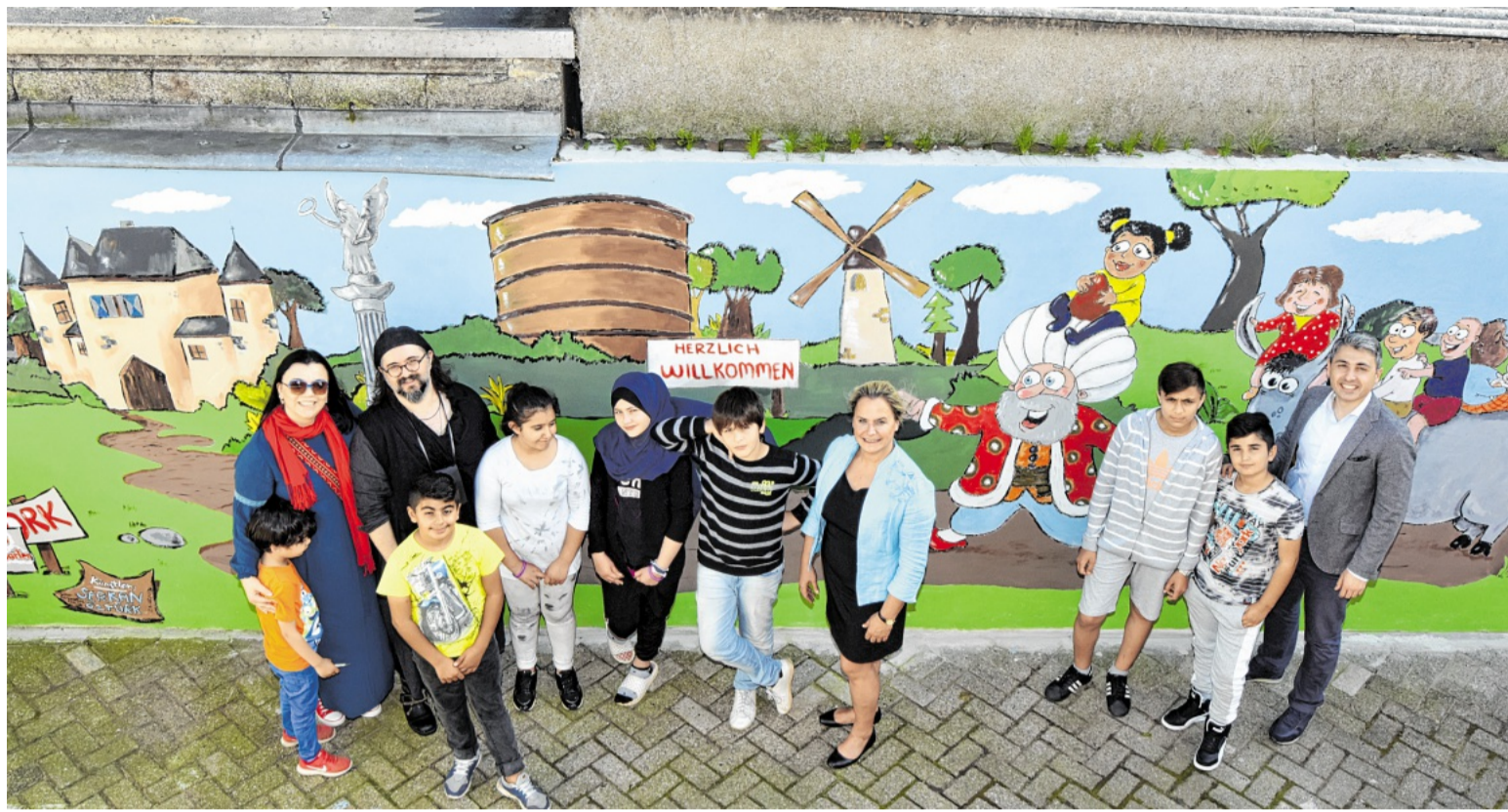
Künstler, Kinder und Unterstützer vor dem großen Wandbild in der Unterkunft an der Duisburger Straße.

Lirich. Zu einem Unfall kam es im Verlauf einer Trunkenheitsfahrt im Stadtteil Lirich: Eine betrunkene Autofahrerin beschädigte auf der Ulmenstraße laut Polizei einen geparkten Audi. Zu der Kollision kam es am vorigen Samstag gegen 5.30 Uhr. Die 48-jährige Frau blieb bei dem Zusammenprall unverletzt. Es entstand ein Gesamtsachschaden von rund 1800 Euro. Ein Alco-Test ergab bei der Fahrerin einen Wert von über 0,8 Promille. Eine Blutprobenentnahme wurde angeordnet und der Führerschein der Fahrerin wurde vor Ort von den Beamten sichergestellt.