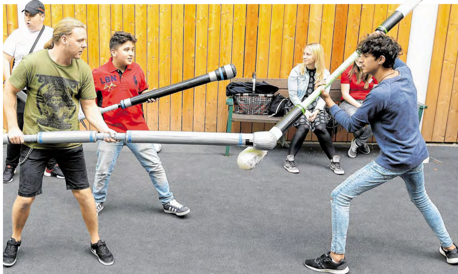
Auch beim Jugger-Spiel hatten die Jugendlichen während der Dankeschön-Party im „Place 2 Be“ ihren Spaß.

Alt-Oberhausen. Der letzte Cowboy kommt definitiv nicht aus Gütersloh, auch wenn ein Country-Evergreen dies behauptet. Der letzte Cowboy kommt aus Gladbeck und heißt Rainer Migenda. Sein Motto lautet „Mit Gitarre, Herz und Hut“. Migenda ist in Gladbeck ein stadtbekannter Künstler; er gibt mit Stimme und Gitarre in Oberhausen eine bodenständige Vorstellung: Am Donnerstag, 28. September, gastiert der Musiker ab 19 Uhr im Restaurant „Salzbergwerk“ an der Langemarkstraße 14. Warmherzig und echt. Der Eintritt ist frei. Der Hut geht rum.