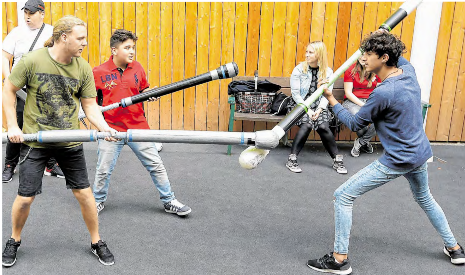
Auch beim Jugger-Spiel hatten die Jugendlichen während der Dankeschön-Party im „Place 2 Be“ ihren Spaß.

Alt-Oberhausen. Der letzte Cowboy kommt definitiv nicht aus Gütersloh, auch wenn ein Country-Evergreen dies behauptet. Der letzte Cowboy kommt aus Gladbeck und heißt Rainer Migenda. Sein Motto lautet „Mit Gitarre, Herz und Hut“. Migenda ist in Gladbeck ein stadtbekannter Künstler; er gibt mit Stimme und Gitarre in Oberhausen eine bodenständige Vorstellung: Am Donnerstag, 28. September, gastiert der Musiker ab 19 Uhr im Restaurant „Salzbergwerk“ an der Langemarkstraße 14. Warmherzig und echt. Der Eintritt ist frei. Der Hut geht rum.